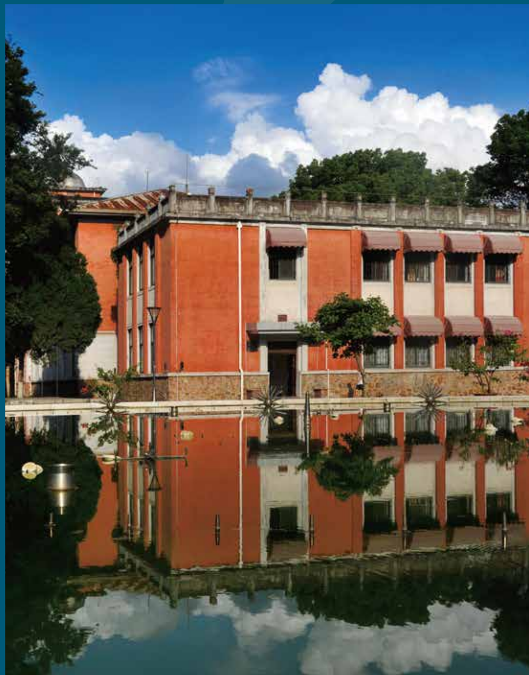
CENTRAL CHINA NORMAL UNIVERSITY 忠诚博雅 朴实刚毅

Central China Normal University (CCNU) was founded in 1903 in Wuhan, the capital city of Hubei Province. Central China Normal University (CCNU) is a key comprehensive university under the direct administration of the Ministry of Education. As one of the universities on the list of 211 National Education Priority Project, Central China Normal University is highly recognized as an important base for cultivating brilliant talents for the country as well as a superior training center for excellent teachers in institutions of higher learning.